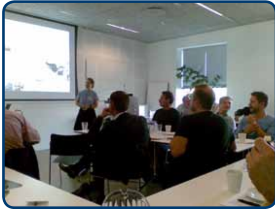
Netværksmøde i Kolding

I løbet af året har AlmenNet oplevet en medlems-tilgang af tre nye boligorganisationer, nemlig FællesBO (Herning), Espergærde Andelsboligforening og Boligforeningen Vesterport (Frederikshavn). Derudover har en række boligorganisationer, som pt. ikke er medlemmer, meldt deres interesse. Vi er meget glade for indmeldelserne, der både styrker vores forening og skaber endnu bedre muligheder for vidensspredning og innovation. Aktuelt har AlmenNet 41 medlemmer, som repræsenterer 62% af den almene boligmasse.