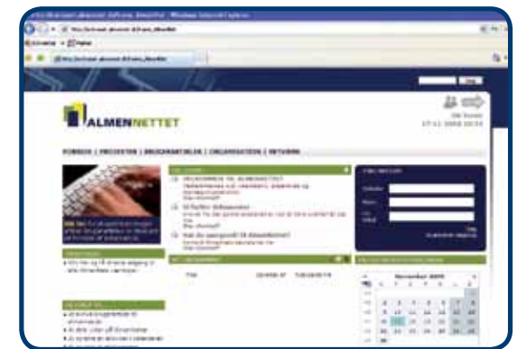
Almennets nye ekstranet