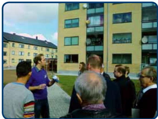
Besigtigelse på netværksmøde

lemmer, hvis det reelt er konsulenten, der udfører projekarbejdet.