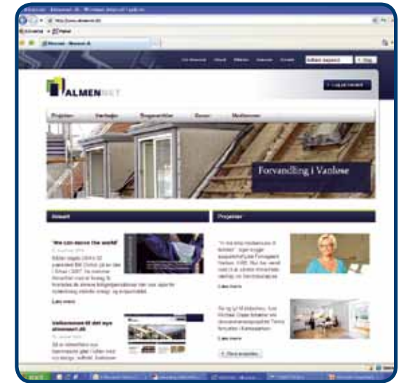
Almennets nye hjemmeside

En tredje vigtig forbedring af kommunikationen er foreningens nyhedsbreve. Nyhedsbrevene har været igennem en fornyelseskur og er blevet strammet op. De udsendes nu fire gange om året til alle medlemmer. Sidst men ikke mindst har foreningen fået lov til at få sendt nyhedsbrevet ud sammen med 'BL informerer', hvorved nyheder fra AlmenNet kommer ud til samtlige boligorganisationer i Danmark. Det giver sig selv, at dette er et stort plus for kommunikation udadtil.