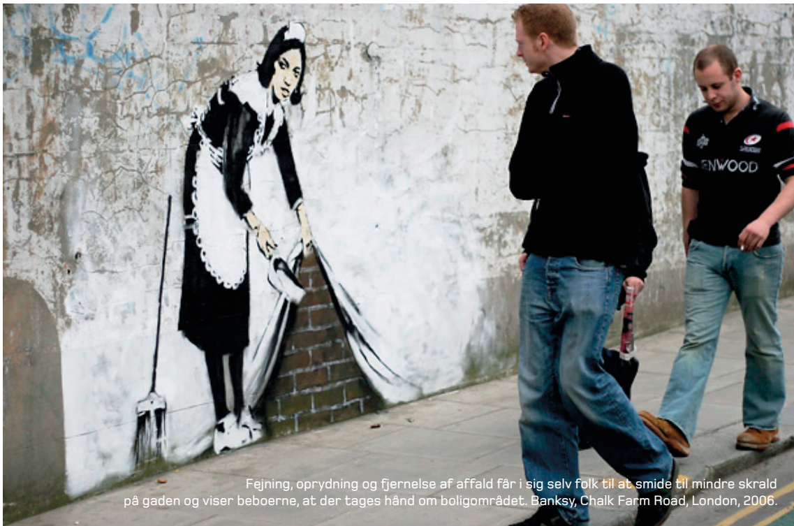
Fejning, oprydning og fjernelse af affald får i sig selv folk til at smide til mindre skrald på gaden og viser beboerne, at der tages hånd om boligområdet. Banksy, Chalk Farm Road, London, 2006.