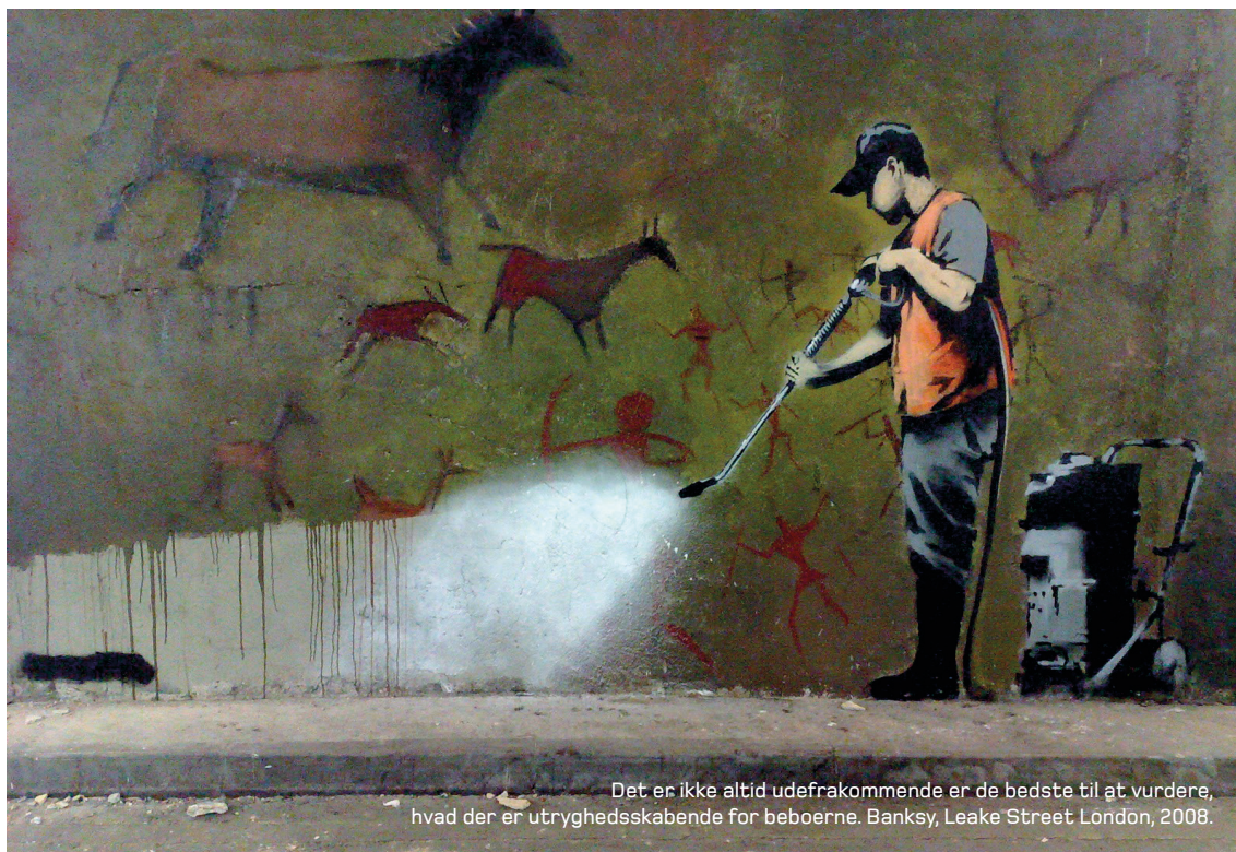
Det er ikke altid udefrakommende er de bedste til at vurdere, hvad der er utryghedsskabende for beboerne. Banksy, Leake Street London, 2008.

Overvej tidspunktet for målingerne. Da lysmængden på forskellige tidspunkter af året varierer betragteligt, påvirkes beboernes oplevelse af tryghed i forbindelse med at færdes i boligområdet. Dette skal overvejes, når en før- og eftermåling sammenlignes eller hvis der sammenlignes med andre tryghedsmålinger. Man bør derfor generelt tilstræbe, at før- og eftermålingerne foretages på samme årstid, eller alternativt om efteråret og foråret (Heber, 2008: 21).