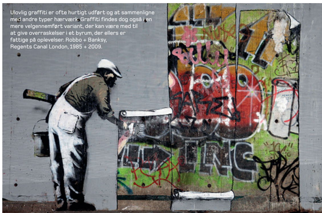
Ulovlig graffiti er ofte hurtigt udført og at sammenligne med andre typer hærværk. Graffiti findes dog også i en mere velgennemført variant, der kan være med til at give overraskelser i et byrum, der ellers er fattige på oplevelser. Robbo + Banksy, Regents Canal London, 1985 + 2009.

Udfordringen i mange udsatte boligområder består derfor i at få skabt flere og mere spredte turmål for beboerne og besøgende især om aftenen. Her er det kun fantasien, der sætter grænsen, og pointen her er da også først og fremmest, at man i tryghedsindsatser ikke behøver at arbejde med at minimere utryghed. Der ligger således store muligheder i at styrke bylivet og aktiviteterne i boligområdets offentlige rum for derigennem at øge trygheden.