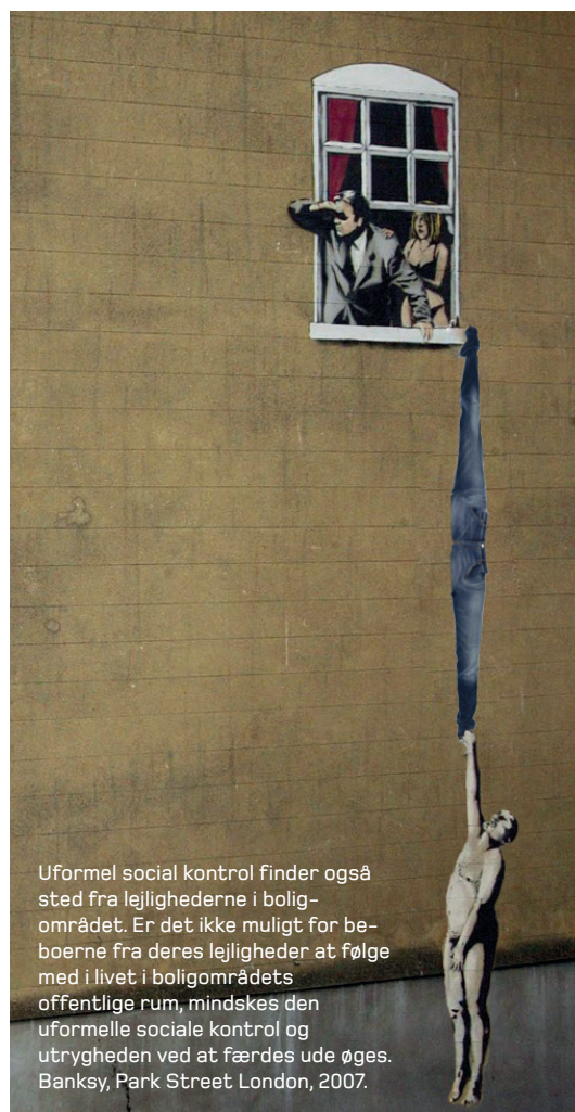
Uformel social kontrol finder også sted fra lejlighederne i boligområdet. Er det ikke muligt for beboerne fra deres lejligheder at følge med i livet i boligområdets offentlige rum, mindskes den uformelle sociale kontrol og utrygheden ved at færdes ude øges. Banksy, Park Street London, 2007.

Denne type tiltag, hvor man analyserer det enkelte byrum som ramme for at beboerne kan udøve uformel social kontrol og efterfølgende gennemfører mindre forandringer, kan antageligt være ganske effektivt. Det kræver blot, at disse trygge byrum tilsammen skaber et net af trygge steder at færdes for beboerne, så beboerne helt kan undgå utrygge steder i boligområdet. Ellers er der ganske stor sandsynlighed for at potentielt