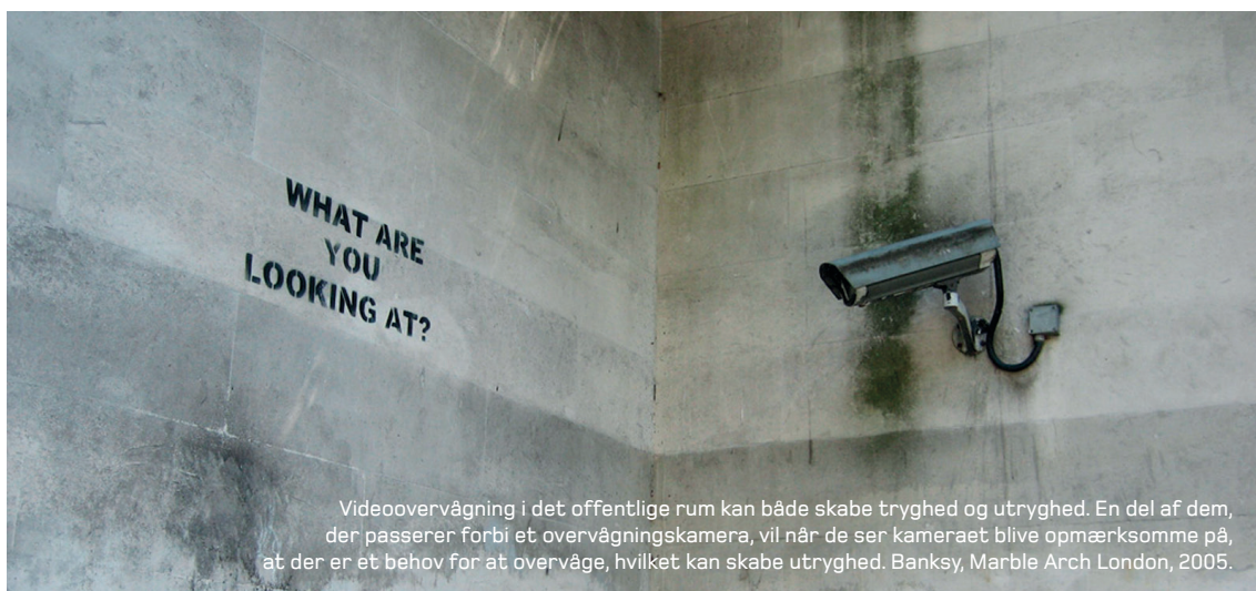
Videovervågning i det offentlige rum kan både skabe tryghed og utryghed. En del af dem, der passerer forbi et overvågningskamera, vil når de ser kameraet blive opmærksomme på, at der er et behov for at overvåge, hvilket kan skabe utryghed. Banksy, Marble Arch London, 2005.